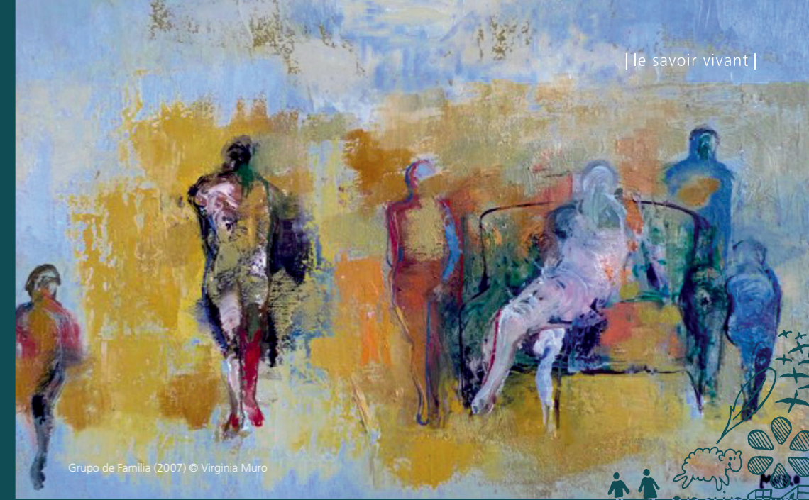
Grupo de Familia (2007)

Université de Strasbourg 22, Rue René Descartes F– 67084 Strasbourg Cedex